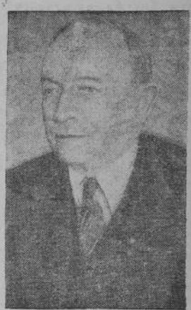
Председатель Президиума Верховного Совета Карело-Финской ССР О. В. Куусинен.