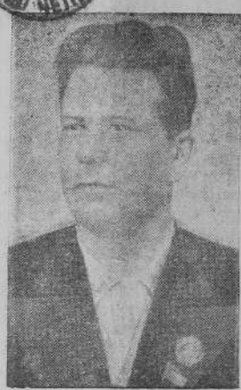
Первый секретарь ЦК КП(б) Карело-Финской ССР Г. Н. Кулрянов.